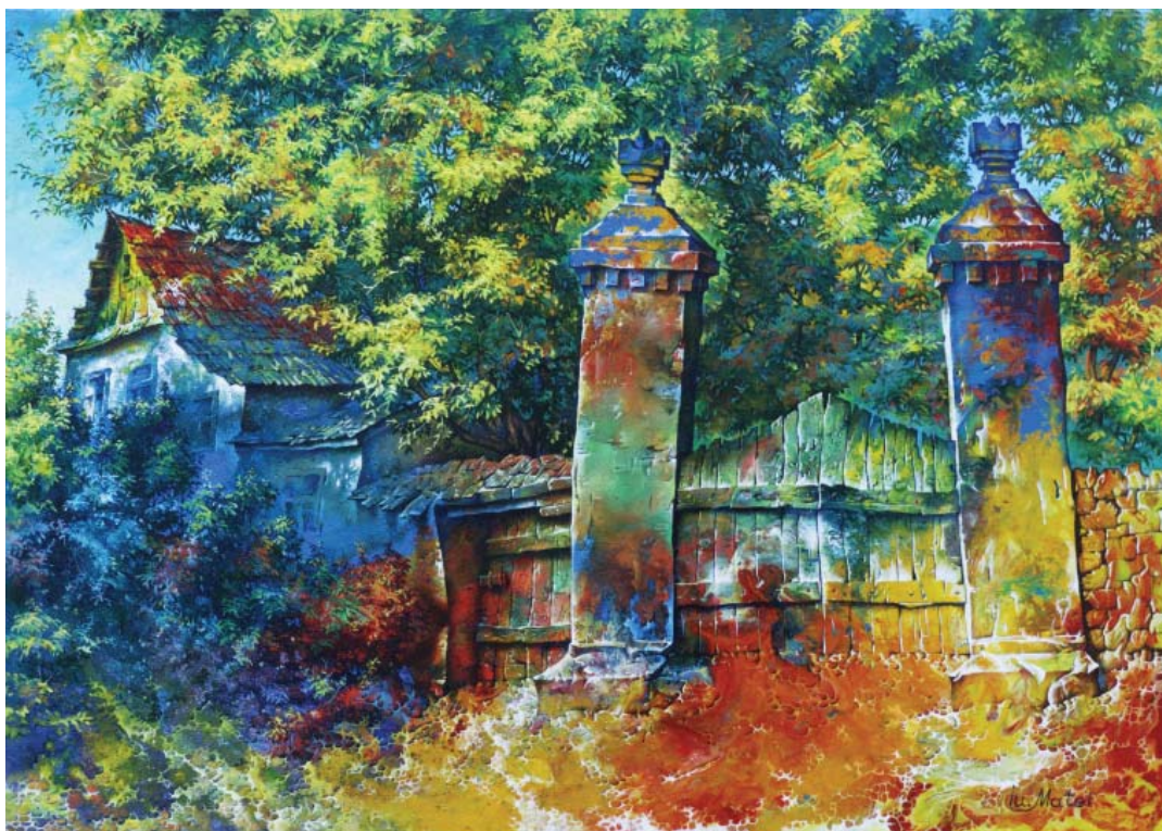
Iurie Matei. Butuceni. Toamnă . 2007, ulei/pânză, 60x75 cm.

În această ordine de idei, considerăm oportună inițiativa Institutului de Studii Enciclopedice al Academiei de Științe a Moldovei de a realiza o serie de schițe cu caracter biografic și genealogic consacrate personalităților marcante autohtone.